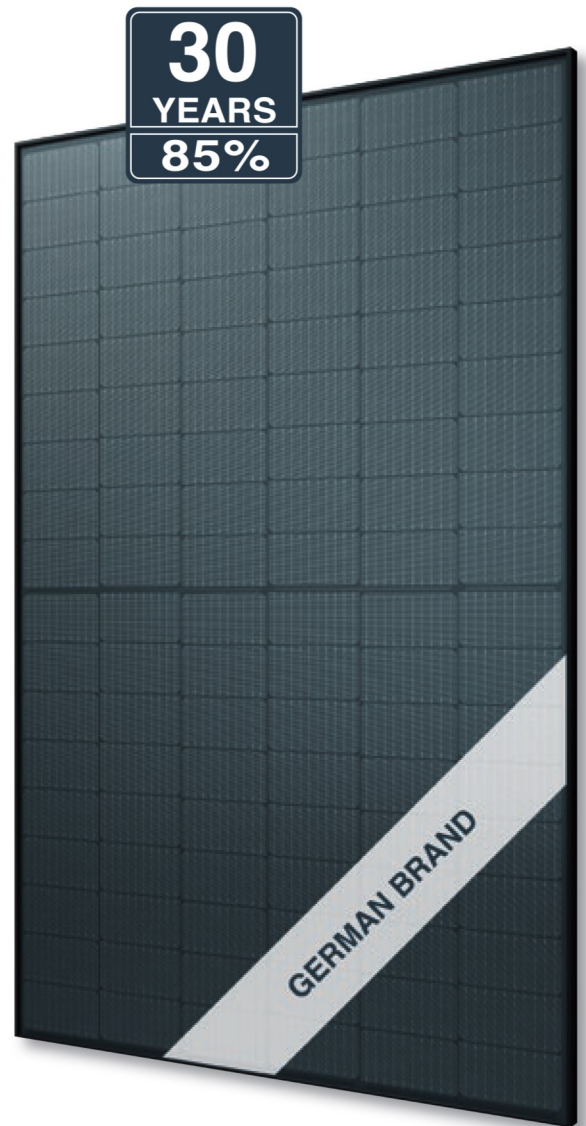
Abb. ähnlich 108MGDE220829A